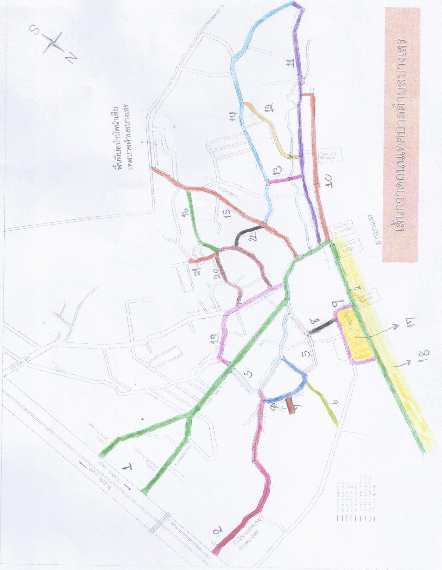
เส้นทางภาคถนนเทศบาลตำบลบางเสา